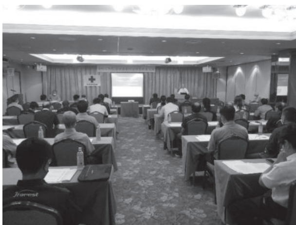
(R4年度 安全衛生大会)

当組合が管轄する区域は能代市・山本郡内で、組合員数は4,293名・組合員所有面積は27,251haです。森林経営管理状況調査・境界調査等の取組状況について、林野庁主催の「森林シューセキ!事例報告会」に参加しました。